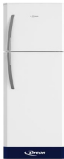
HELADERA DREA CICLÍSTICA 370 LITROS BLANCA

EXCEPTO SAN JUSTO - AVELLANEDA - NEUQUEN