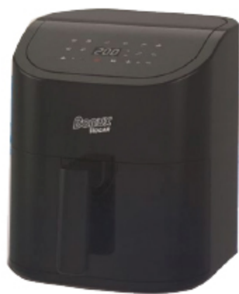
FREIDORA DE AIRE DIGITAL BONUX/VTL 4,5 L