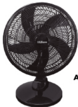
VENTILADOR DE MESA LILIANA ASPAS PLÁSTICAS 16,5"

POR CUOTA SOBRE PRECIO DE LISTA: $ 616.716,00