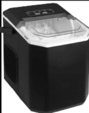
MÁQUINA DE HIELO VTL 1,2L

POR CUOTA SOBRE PRECIO DE LISTA: $ 302.064,00