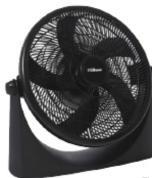
VENTILADOR LILIANA TURBO 18"

POR CUOTA SOBRE PRECIO DE LISTA: $ 50.352,00