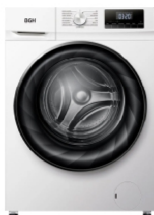
LAVASECARROPAS INVERTER 10 KG BLANCO EXCEPTO SAN JUSTO, MALVINAS, ABASTO, QUILMES