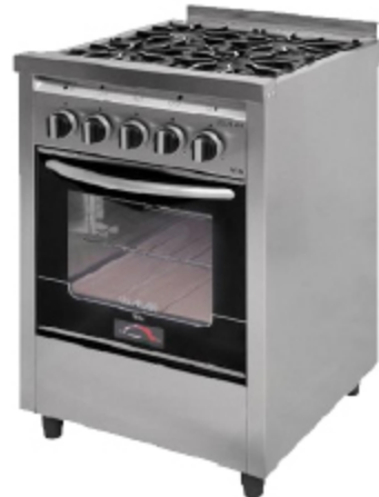
COCINA INDUSTRIAL USMAN 4 HORNALLAS EXCEPTO ABASTO, MAR DEL PLATA / NEUQUÉN

POR CUOTA SOBRE PRECIO DE LISTA: $ 1.107.576,00